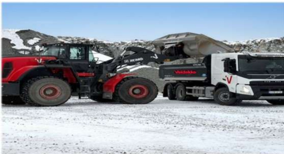
Elektrisk lastning på Gillingekrossen

Vi vill att hållbara val ska vara tillgängliga för alla, därför har vi arbetat målmedvetet för att priset inte ska stå i vägen för att göra det där lilla extra. Med tydlig dokumentation kan vi dessutom visa vilken skillnad ditt val faktiskt gör.